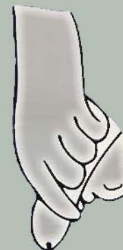
Al retirar el prepucio se descubre el glande

Si el niño no sabe, los padres le ayudarán hasta que aprenda. No se debe intentar dejar la punta del pene completamente descubierta ya el primer día.