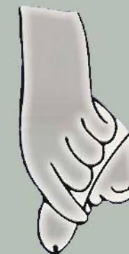
A l'enretirar el prepuci es descobreix el gland.

Si el nin no ho sap fer, els pares l'ajudaran fins que n'apregui. No s'ha d'intentar deixar la punta del penis completament descoberta ja el primer dia.